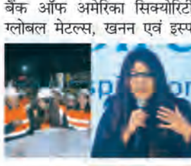
बैंक ऑफ अमेरिका सिक्वोरिटीज ग्लोबल मेटल्स, खनिज एवं इस्पात

का लाभ उठाने के लिए अच्छी स्थिति में है। खनिज और धातु क्षेत्र के पास भविष्य की तैयारी करने की कुंजी है। उन्होंने कहा कि वैश्विक स्तर पर शुद्ध-शुभ लक्ष्यों को हासिल करने के लिए खनिजों की महत्वपूर्ण भूमिका होगी और इस मांग को पूरा